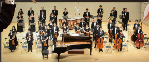
管弦楽 オーケストラ・アンサンブル佐野