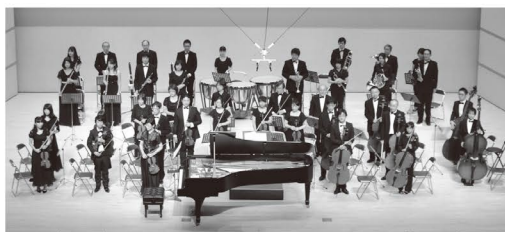
オーケストラ・アンサンブル佐野 Orchestra Ensembles Sano

1998年より東京藝術大学非常勤助手及び非常勤講師を経て、2015年より東京藝術大学音楽学部指揮科助教。